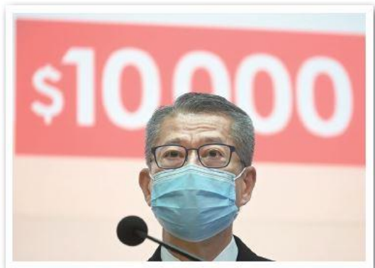
圖 2.1 財政司司長陳茂波強調政府「每個市民都愛護」，絕不存在歧視。

因應 2019 冠狀病毒病（COVID-19）疫情重創本港經濟，財政司司長陳茂波在 2020 年 2 月發表《財政預算案》時，宣布向 18 歲香港永久居民每人派發 1 萬港元，不過新來港人士卻不包括在受惠人士之中。有部分新來港人士質疑政府是否帶頭歧視新移民，指出新移民亦有為香港貢獻，應同樣獲得受惠資格。事後，陳茂波回應新來港人士在現有制度下亦能享受一定福利，並在 3 月宣布透過關愛基金向新來港的低收入人士發放一次性現金津貼。