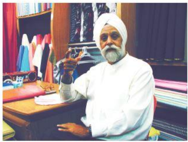
圖 1.1 印度錫克教徒的衣飾裝扮

香港是一個華洋共處的國際城市，除了華人外，也有英國、美國、日本、菲律賓等外國族裔。不同國家的地理環境、歷史和宗教背景都不一樣，各有獨特的文化，例如華人會在農曆新年封紅包， 部分 印度男士會以頭巾裹頭等。