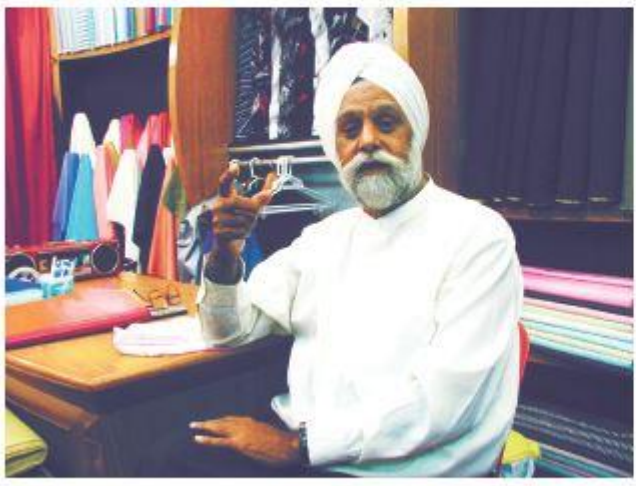
圖 1.1 印度男士的衣飾裝扮

香港是一個華洋共處的國際城市，除了華人外，也有英國、美國、日本、菲律賓等外國族裔。不同國家的地理環境、歷史和宗教背景都不一樣，各有獨特的文化，例如華人會在農曆新年封紅包，印度男士會以頭巾裹頭等。