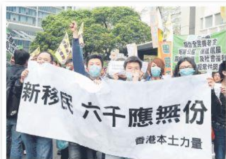
圖 2.1 香港某團體反對政府向新來港人士派發 $6,000。