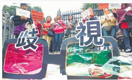
圖 2.2 社區組織協會與一班新來港人士到政府總部請願，指政府的「派錢措施」帶頭歧視新來港人士。