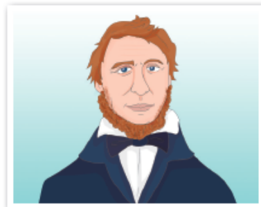
圖 3.8 美國作家亨利·戴維·梭羅

公民抗命，又稱為公民不服從，或不合作運動、不抵抗運動，是美國作家亨利·戴維·梭羅 (Henry David Thoreau) 在 1849 年《論公民的不服從》一文中提出的概念，當時他為反對戰爭和奴隸制度而拒絕向美國聯邦政府納稅，公然反抗法令，因而入獄。