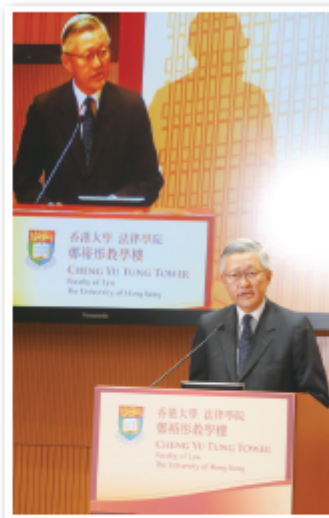
圖 3.3 終審法院前首席法官李國能曾表示，法治與司法獨立對維持香港繁榮安定「極為重要」。

在刑事訴訟中，根據《基本法》，任何人被合法拘捕後，在法庭判罪前，應該假定他是清白無罪的，以保障人權。