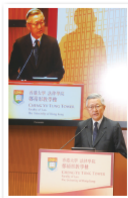
圖 3.3 終審法院前首席法官李國能曾表示，法治與司法獨立對維持香港繁榮安定「極為重要」。

《基本法》知多點 第 87 條 (節錄) 任何人在被合法拘捕後，享有盡早接受司法機關公正審判的權利，未經司法機關判罪之前均假定無罪。