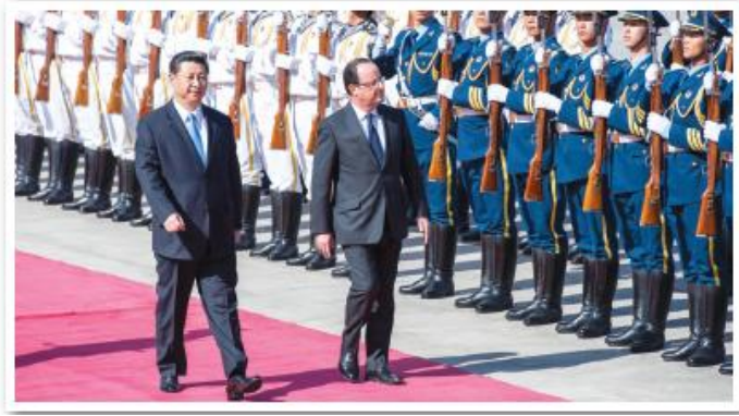
圖 2.1 2013 年，中國國家主席習近平在北京歡迎法國總統弗朗索瓦·奧朗德訪華，雙方同意加強經貿合作。