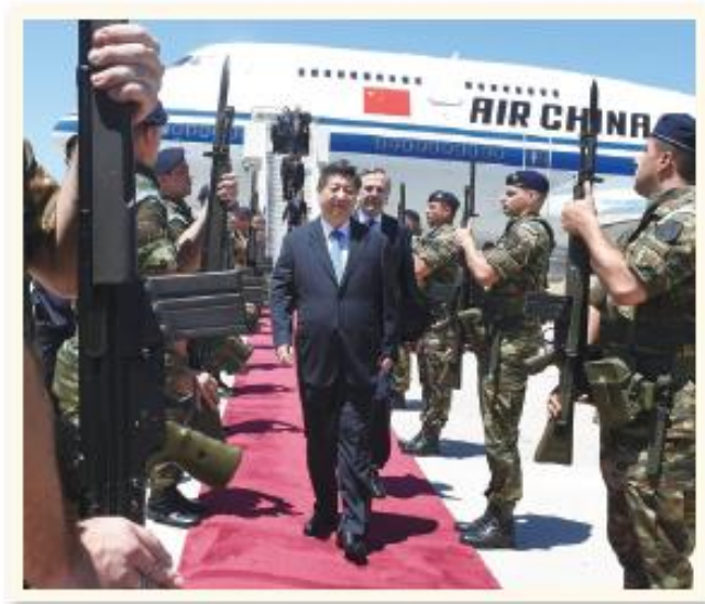
圖 2.1 2014 年，中國國家主席習近平在前往巴西出席第六屆金磚國家峰會途中，先在希臘稍作停留。圖為希臘總理專程從首都雅典來到機場歡迎。